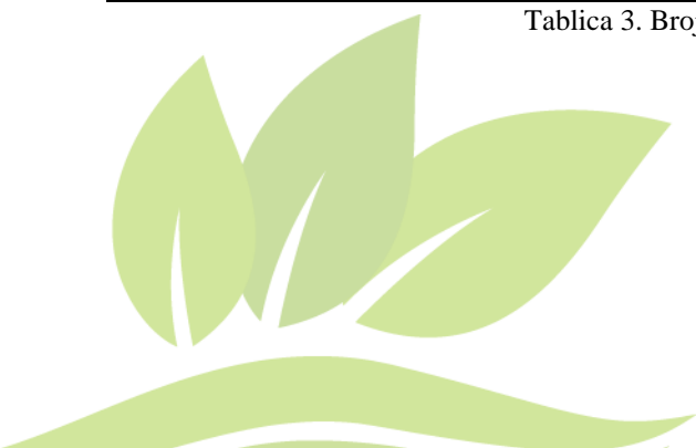
Tablica 3. Broj vozila