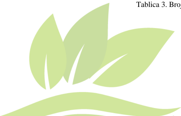
Tablica 3. Broj vozila